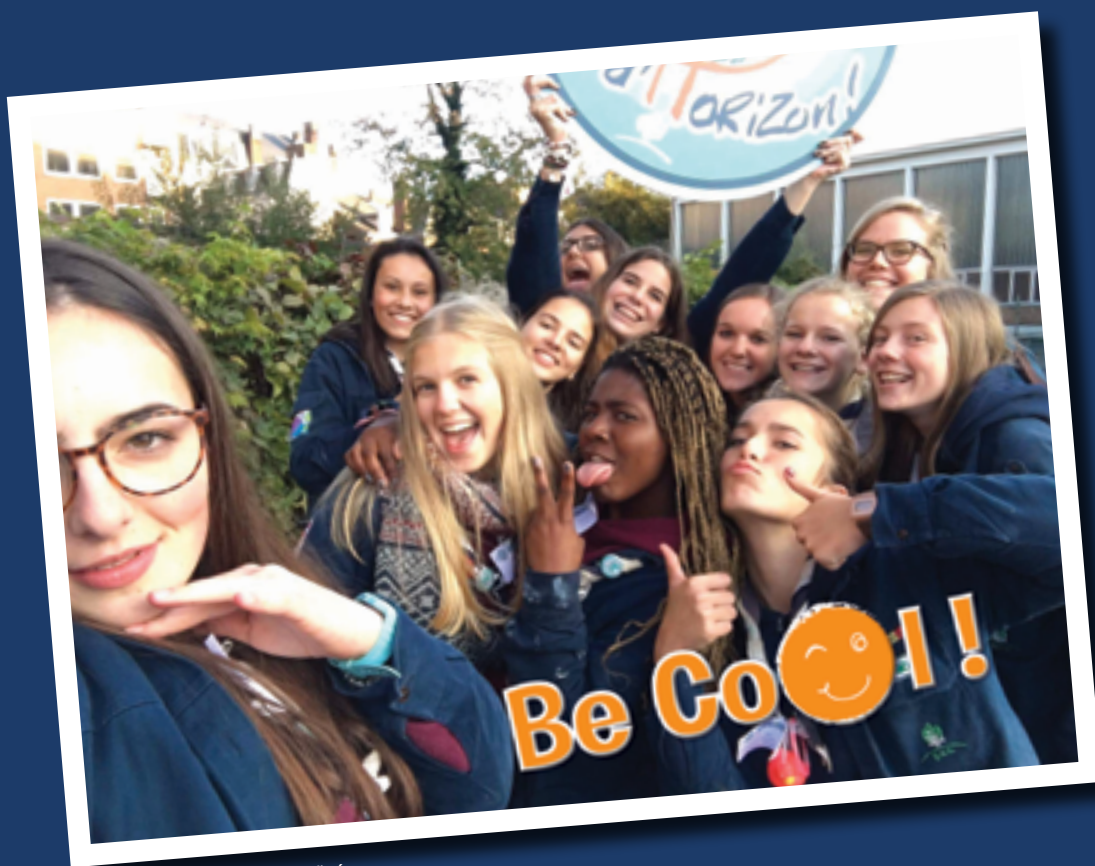
44 e LCO - St Hadelin - Visé

Rédaction : Sophie Belien (Service Pédagogique et Appui Formation). Conception, illustration et réalisation graphique : Marielle Bauters.