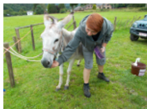
Séraphine toujours en séance de nettoyage